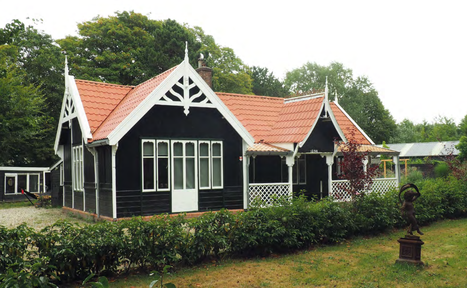
Houten prefab clubhuis uit Engeland